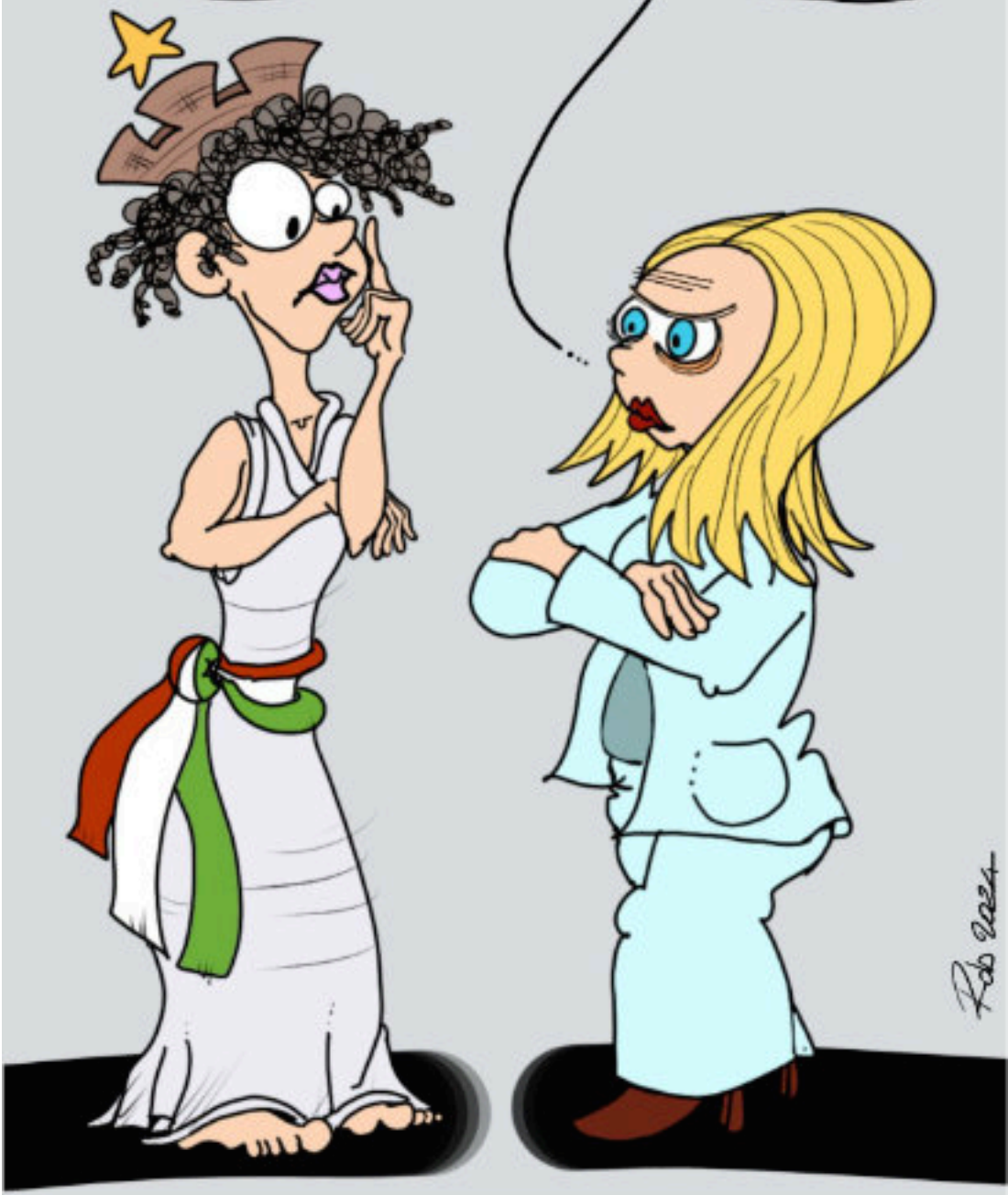
5 FEBBRAIO 2024 Solito vittimismo ...